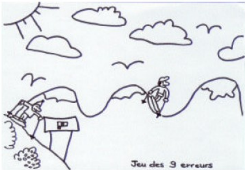
Jeu des 9 erreurs