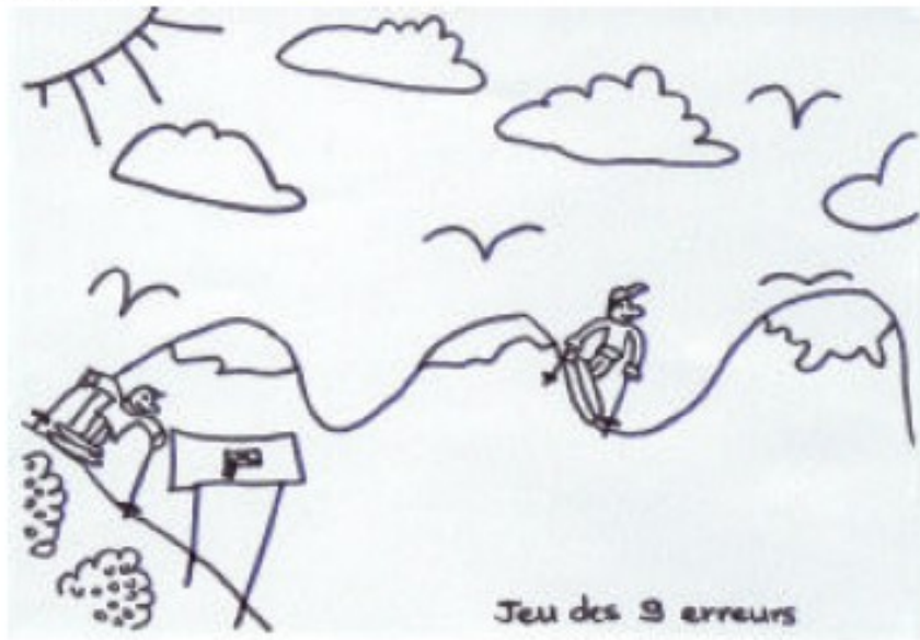
Jeu des 9 erreurs